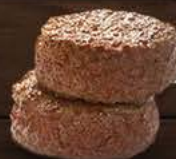
Miniburger di bovino • 23 gr. cad.

Carne di Bovino Adulto 98%, sale, aromi naturali.