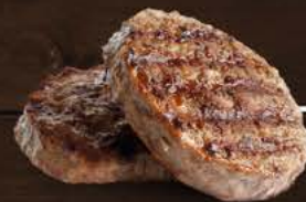
Hamburger di bovino 90% carne 100 gr. cad.

Carne di Bovino adulto 90%, soia, fibra vegetale, sale, destrosio, amido, pepe, aromi.